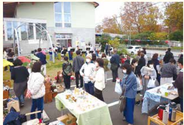
ボランティアさんによるお庭でのマルシェ。