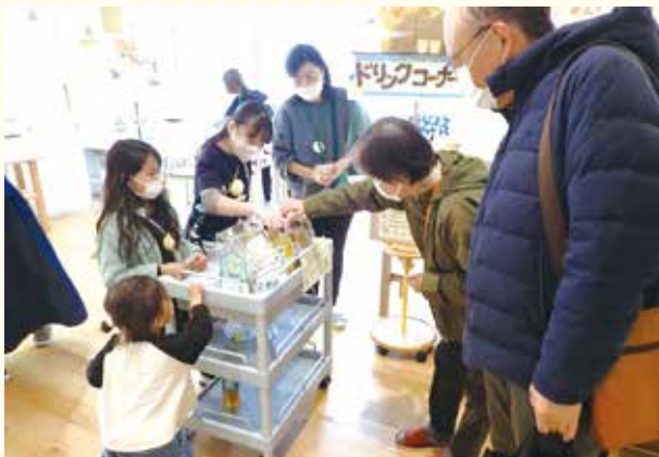
チャリティドリンク販売にチャレンジ。