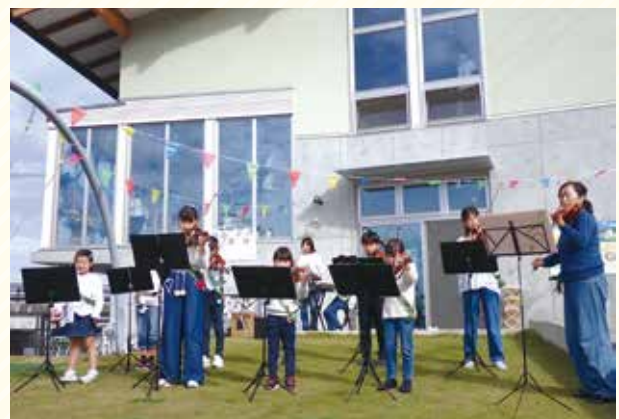
地域の子どもによる演奏のプレゼント。 （ランクリエ・アイネクライネ音楽隊）