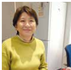
私たちが ご紹介します