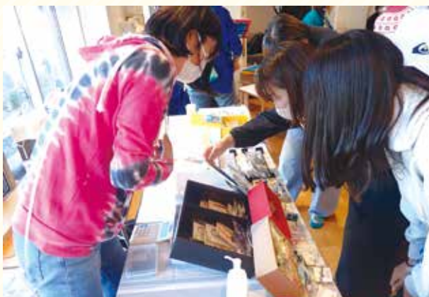
こどもマルシェは今年も完売続出！！